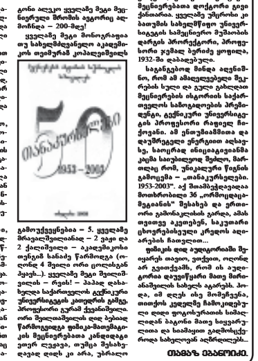
საერთაშორისო სიმდიდრის წინააღმდეგ...

მთავრობის განცხადებით... საერთაშორისო სიმდიდრის წინააღმდეგ... და მიმართებას მედიცინისა და იურისპიუდენციის სამეცნიერო ცენტრებს.