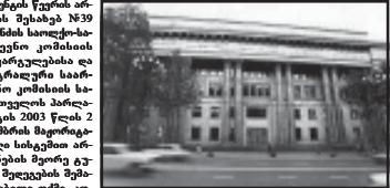
სხლამეუ კანისილეს, ბერუკუ, რიგი სხვი სკოისიხი. სანაშრომი

რეგისტრაცია გაიარა 35-მა პარტიამ. რეგისტრაციის პროცესი დასრულდა და 35 პარტია მონაწილეობს.