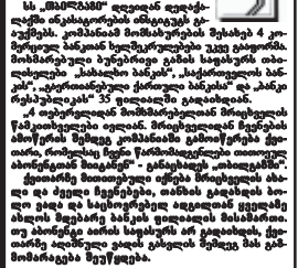
სამხრეთში პრეზიდენტის სახსრებით...