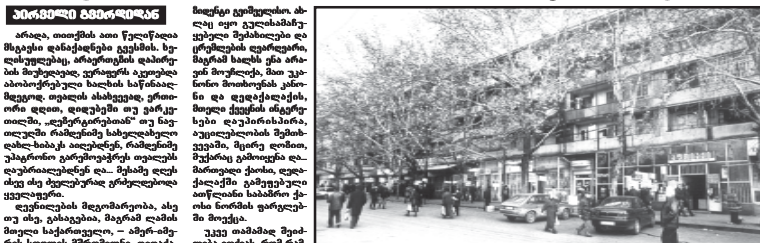
სამხრეთში პრეზიდენტის სახსრებით...