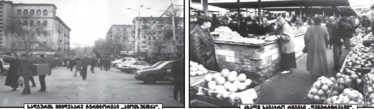
სამხრეთში პრეზიდენტის სახსრებით...