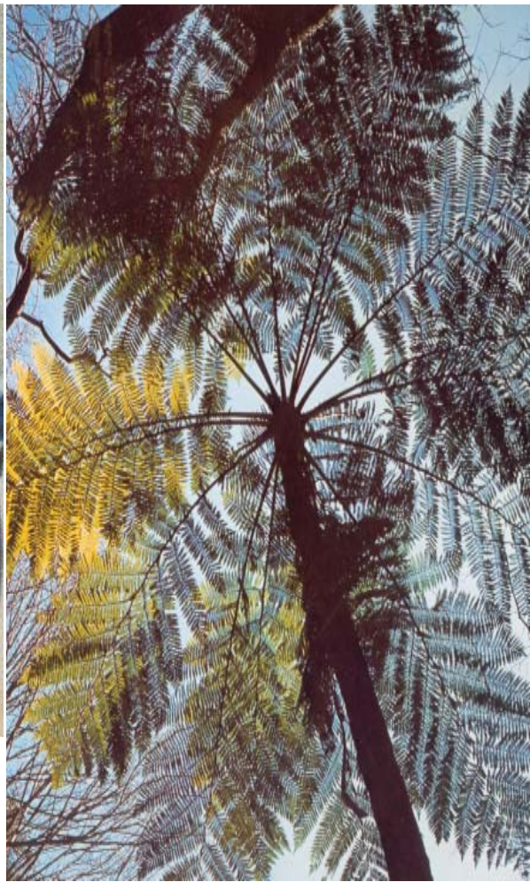
პროექტ „გვიმარას“ თანამოსაგრეთა ჯგუფი