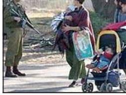
რაც შეეხება დამის სექტორიდან მდინარე თორღვანის დასახლებაში პირველ ებრაელ მოსახლეთა გადაყენების, პალესტინის ავტონომიის პრემიერ-მინისტრმა აბმეფ ქურეიმ განაცხადა, რომ ეს იდეა მიუღებელია.

ამეფ დროს, საპროექტოები ან-რის გამოკითხვა მოქმობს, რომ მოსახლეობა, პრინციპში, მხარს უჭერს შარონის იდეას.