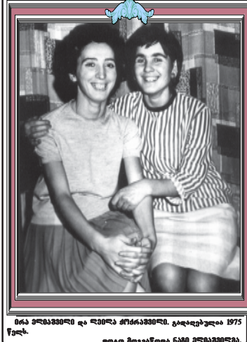
მის პირადობა და ლაპარაკი მის შესახებ. კარგად უნდა იცნობდეს...