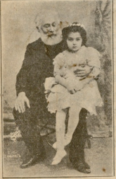
აპაი და კატარა შაბი (სურ. 1)

საფორალე — დედის ქაფი, ან განიცვლივის სხვაზედა, ორივ ტაბილია, მხოვლილ, მირამინის ორსვ თვალზედა, როგორც უხალი, საფორალეც მართი კვანავაზედა.