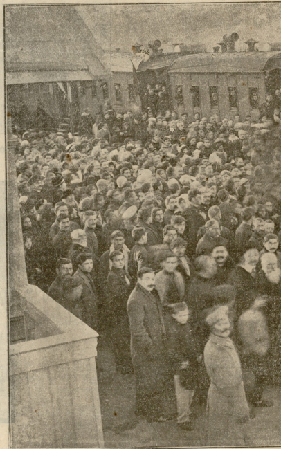
აკაკის ცხედრის შეს.