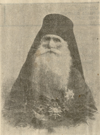
იმერეთის ეპისკოპოსი ყოფილად სამღვდელით გაიარა. (ნისი ავთოიუგობის გავო)

დაკორძებულ ხელის გულით საძირკველი მოგიზადე, ტანჯვის ცრემლში ბევრჯელ განენ, სასიოებით გამოგზარდე.