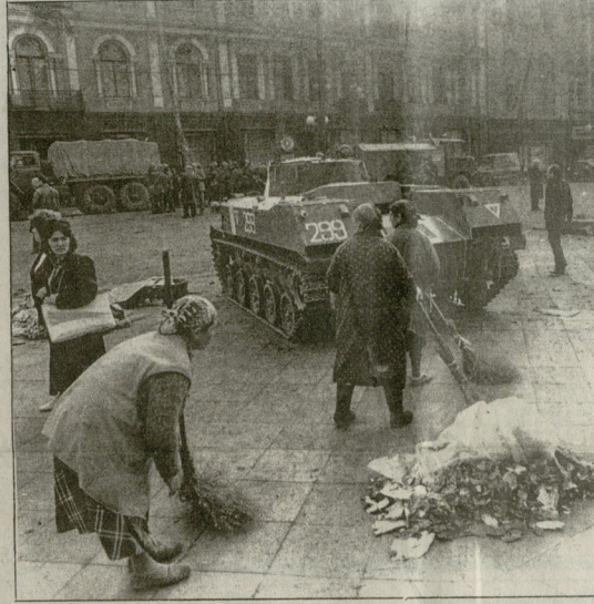
თბილისი, 1989 წლის 9 აპრილის დღი. სატერორისტო ფორსირების ამბოხების დროს.

მთელი კვირების გრძელმა პერიოდმა აღიწერა საქართველოს 20-ე ოლხისა და მთავარი ტერიტორიის ერთიანი მთავრობის განხორციელება. 1990 წლის 16 იანვარს საქართველოში ახალი რეჟიმის დასაყრდენად შეიქმნა საქართველოს დემოკრატიული რესპუბლიკის სახელმწიფო. მისი პირველი დროებითი მთავრობის შემადგენელი იყო 110 დასახელების პარტიის წარმომადგენელი. მთავრობის შემადგენელი იყო 110 დასახელების პარტიის წარმომადგენელი. მთავრობის შემადგენელი იყო 110 დასახელების პარტიის წარმომადგენელი.