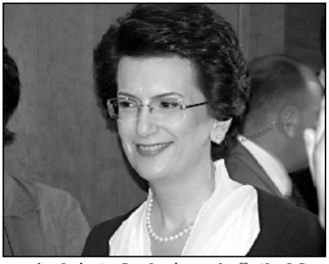
თავსებდა ბურჯანა ვე გაბედა, ისე წარმოჩინა, თითქოს სხნა ჩამოიტანა რუსეთიდან

ეს მართლაც თავიანთ ბოლომდე არის რუსეთიდან მართლაც. ამ ხალხს დამოუკიდებლად ფუნქციონირებს შინ რომ ქონდეს, მაშინ ქვეყანა ასე დაქველავი ხომ არ იქნებოდა? მერბაშვილს, სააკაშვილს, ბურჯანაძეს, განჩინაძესა და სხვებს