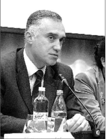
ზვიად ი ივური

რა მდგომარეობაა ქვეყანაში, რამ გამოიწვია ინფლაცია და რატომ იქცევა ასე უცნურად სააკაშვილი, ამის თაობაზე კონსერვატიული პარტიის ლიდერი ზვიად ი ივური „ახალ თაობას“ ესაუბრება.