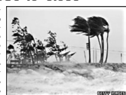
ლონს უნდა გაეკლით, საერთო ჯამში 30 ათასი ადამიანი გა-ზიანეს. მრავალი ავსტრალიე-ლი ციკლონს საყოფარ სახ-ლეში შუგდა.

ავსტრალიის ხელისუფ-ლები ციკლონის მიერ მიყვებულ ზარალის შეფა-სებას ცდილობენ. ციკლონ კენის ჩრდილო-აღმოსავლეთ ნაწილს დაესხა თავს და მნიშ-ვნელობით ზრევა გამოიწვია.