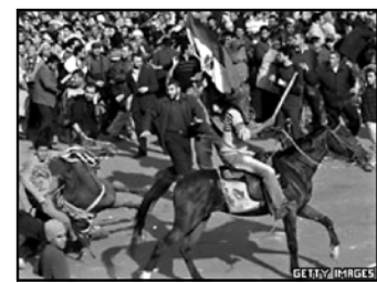
დაღატაკის ქვეყნდება. მან ასევე განაცხადა, რომ მუხარამის სოფლიო გამარტვისაგან ქაიროს მოსახლეობამ დაცვა.

ქაიროს ცენტრში, ტაპირის მოედანზე ეგვიპტის ლიდერის მომხრეებთან გააფორმე-ული შეტაკებების სამი ადამიანი დაიღუპა, 600-ზე მეტი დაზარდა.