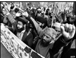
ნარჩობადგენილი ამის შესახებ განაცხადა, მაგრამ ძნელი გასაცხადებელია, თუ როგორ შეიძლება, რომ პაკისტანის და სახარაი-სტანის მთელი მოსწავლეები მკაცრად დაპატიმრდნენ.

ადამიანის უფლებათა დაცვის საერთაშორისო ორგანიზაცია „ჰუმან რაიტს ვოჭტი“ პაკისტანის ხელი-სუფლებას მკრეხელების ბრალდებით დაკავებული მოსწავლის გათავისუფლებას ითხოვს.