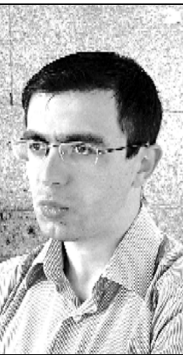
ცინიური დამოკიდებულება აქვს ჩვენს პრეზიდენტს პროცესების მიმართ...

— მე ვფიქრობ, პრეზიდენტი ერთ-ერთი მოკავშირეა ჩვენი, იმიტომ, რომ ეს ცინიზმი გახდა თავის დროზე ერთ-ერთი მთავარი ფაქტორი 2007 წლის ზაფხულში ვახტანგის სახლების დანგრევის და ყველაფერი ის რაც ხდებოდა 2007 წლის ზაფხულში, გახდა იმის განმარტებელი ფაქტორი, რაც მოხდა მერე ნოემბერში. ამიტომ სააკაშვილმა ვერც ვერაფერი ისწავლა, ვერც ვერაფერი დაიფრსა და მე ვფიქრობ, რომ წამდელია ეს ადამიანი ჩვენი მოკავშირეა იმ საქმეში, რასაც ქვედა ახალი ფართობის მშენებელი პროცესის ორგანიზებას.