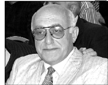
საქართველოში რევოლუციური სამზადისი არ ჩანს

— თორუმულად როგორც კი მმართველ პარტიაში იწყება რაიმე ახალი ფრაქციის ან მით უმეტეს პარტიის ჩამოყალიბების თაობაზე საუბარი, ცხადია ასეთი სახალ გულსხმების სწრაფად ხელისუფლების ჩანაცვლების სურვილი. უკანასკნელ დღეებში ჩვენ ორჯერ ვიყავით მომსწრე ძალისხმევი დაპირისპირების მმართველ პარტიაში, გასურვილად იმისა, იყო ეს სისხლიანი თუ უსისხლო და ასე მიზანპირველი და მთავრე პრეზიდენტის წასვლა ხელისუფლებიდან. თუ ამ შემთხვევაში არის რაიმე მზაობა იმისთვის, რომ შევიდეთინანდ, ყოველგვარი ძალადობის გარეშე მოხდეს ჩანაცვლება ხელისუფლების, იმავე წყაროში წარმოშობილი ძალით, ეს რასაკვირველია, შესაძლებელია, მაგრამ არა