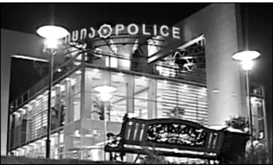
რამდენი ინარჩუნება მით უნახვარე არაგინ იცის