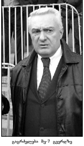
გაერქილება მე-7 გვერდზე

შინდან პენსიას და ხალხს ტაშს აკერებიან ამ უკიდურესი გაჭირვების დროს. პენსია გაიზარდა 5-6 ჯერ, რატომ გაიზარდა 70-ჯერ გამგებლის, გუბერნატორების, მინისტრების და ა.შ. ხელფასები? სააკაშვილის ერთი დღის სამიჯინებო თანხა სასტუმროს და ტრანსპორტის გარდა, არის პენსიონერის მთელი წლის პენსია. ეს რა თავგასულობაა? ამიტომ, ზემოთ რომ მკითხეთ, გასახუბობთ: მძიმე მდგომარეობაში ხელისუფლება კი არ არის, მძიმე მდგომარეობაშია ხალხი. ამ ხელისუფლებას გარეთ მხარდაჭერა რომ არ აქვს, ეს დიდი ხანია ცნობილია. დღეს არის ხელისუფლების შეცვლის საუცხოო მომენტი. ქვეყნის გარეთ უქსაბტების, მოვარობაზე ხელმძღვანელების, ანალიტიკოსების აზრი და ქართველი ხალხის აზრი არათუ დაახლოვდა, არამედ ერთი და იგივეა. უბრალოდ, მათ თქვენს კი, ჩვენ თურმე ცვცვდილით, მაგრამ ახლა სიტყვა ქართველ ხალხზეა. როგორც კი ეს ითქვას, აქ