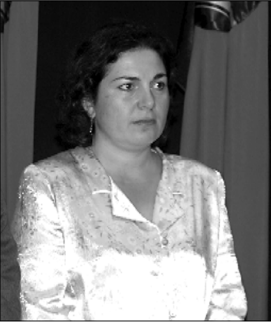
არ შეილება ციხეებში, 1 წლის განმავლობაში 149 ადამიანი იღუპებოდა!

— რაზე მინიშნებით, სააკაშვილს ხალხმა არ უნდა მიეცეს იმის საშუალება, რომ ის კონსტიტუცია აამოქმედოს, რომელიც მილია? — რა თქმა უნდა. არა მარტო კონსტიტუციური პრინციპები უნდა გამოვცვალოთ მათ ხელიდან, არამედ სწორედ ყველაზე უფრო დემოკრატიული გზით — საარჩევნო გზით უნდა გამოვცვალოთ ხელისუფლება. ეს მოთხოვნება მხოლოდ საარჩევნო გზით აშკარად, ვფიქრობ, ასლია საზოგადოების გარნიდება არ შეიძლება. მე, მაგალითად, ვფიქრობუქვას კავშირების მოსაზრებას. მან თქვა, ასლია საზოგადოება იმიტომ არის გაუქმებული და გარნიდება, რომ როცა ჩვენ დამოუკიდებლობისთვის ვბრძობით, ყველაფერს ვცდიდით, რომ ჩვენი ყაველი და ჩვენი თავისუფლების მორჩილად დგავიყო უფრო კეთილია, ასლია, ახლა, როდესაც დავინახეთ, რომ დიქტატორულ რეჟიმში გავცხოვრებდნენ ჩვენივე თვისობის ხელისუფლებას, იმდენად მიმი და ერთი შეხედვით დაუჯერებელიც კია, რათა ამას ნამდვილად დარწმუნებულ და ამის ნინააღმდეგ ბრძოლა დავინახო. მე ვფიქრობ, სწორედ ეს სიტუაციაა. ჩემი და უფროსი თაობის საზოგადოების ნამდვილად გულში არ შეუძლია დარწმუნება, რომ ჩვენი ციხეები უბრალოდ კი არ უნდას, მათ დაინყეს და ძალიან საბრძოლველ დასარწმუნებელია, საზოგადოების ეს ნანიჩი ჩარევით სადაც ჯანდაბალა, ახალგაზრდებს გამოუღაყინ ტვირი, რომ მათ გართობისა და დროსტარების მეტი არაფერი აინტერესებთ. ის, ვისაც თავში რაღაც უფროა, აიძულონ, ქვეყანას თავი გადართოს და საშუალო უფსოველი ვქნობს. ის პროცესი, რაც ახლა მიმდინარეობს, ვფიქრობ, ამის ნაიული გამოსატყულებაა.