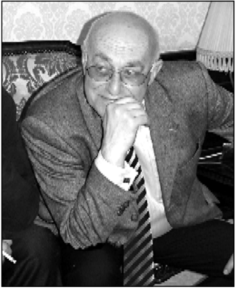
ხის პროტესტი არაადემოკრატიული რეჟიმების მიმართ, ამ ინსტრუმენტების ამერიკის მეერთებულ შტატებში სრულად ფლობს და ვფიქრობ, შეიძლება დადგეს დრო, როცა საკუთარი ხელისუფლალათიყის აღარ იყოს რამიმ ხილვის შემცველი ქვეყნის მმართველობა, რადგან მათი საქმიანობის არცელი შეიძლება შემოიფარგლოს სარწმუნო ნიციელ ხიდადმე.

— აბა, რა გითხრათ, სტანდარტულ არა მგონია იყოს რამიმ წარმატების ნიშანი, აქამდე სწორედ ამ ვითარებაშია მოლაპარაკების პროცესი. თუმცა, პერსპექტივა რეალისტის პოზიციის ნამდვილად აქვს, ვფიქრობ, ხელისუფლება ამ თუ იმ ფორმით მინც იძულებული გახდება, გააგრძელოს მოლაპარაკება საარჩევნო გარემოსთან დააკავშირობით. ქალბატონი კლმონის უკანასკნელი განცხადებაც მარწმუნებს, რომ დაფარული აღმინისტრაციის ხელმძღვანელობისთვის აღარაფერია. მათი დილომატიური არხი ბოლოს და ბოლოს ამტკიცებდა ბევრად მეტე სინუსტრად, ვიდრე ეს წინა წლებში იყო. ამიტომ არსებობს სხვადასხვა ხარის-