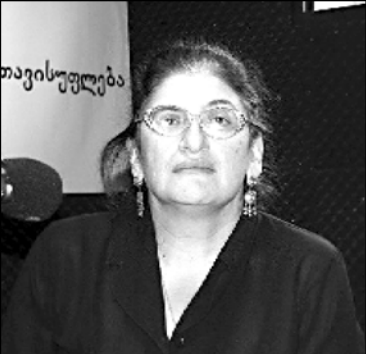
საინჟინერო-ტექნიკური უნივერსიტეტის დირექტორი