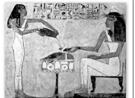
მამერტი მიხიდა უხედეხი ხანის ლულის ტექნოლოგიის კვლევაში, რადგან ის იძლიდა შესაძლებლობას კაცობობის ისტორიის არტულ ეტაპებზე გამოყენებულ მკურნალობის მეთოდების შესასწავლად. „ანტიბიოტიკი ხხრად მიიწვენ თანამედროვე დაზიანებობების გამოყენებად, თუმცა ავამიანებისთვის ბუნებაში არსებული ანტიბიოტიკების მოქმედება უფრო დიდი ხნის წინათ იყო ცნობილი ვიდრე ვგონათ.“ — აღნიშნა მას.

მამერტმა, რომელმაც ლულის ხარშისთვის გამოიყენა რამდენიმე უხედეხი მეთოდი, პირველი მძღვლები პარტი ალწერო როგორც ალალისგარეო და შეეცე. გასათვალისწინებელია, რომ სხვა, თანამედროვე ლულის მნიშვნელოვანი კომპონენტი, ხელმისაწვდომი არ იყო ძველ აფრიკაში. სისის შემავარგნობის მი შეეცადა მძღვლები კი ასრულდნენ კონსერვანტების როლს, ამიტომ ნებისურები საფარულად საკუთარი წარმოების ლულის დამზადებისთანავე სეამდნენ.