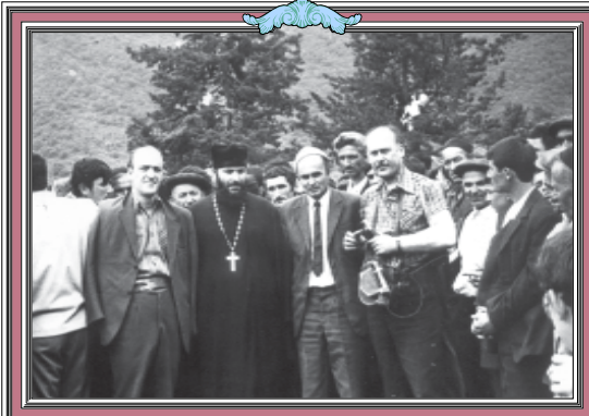
მედიაციის მოქმედებით ვიხსოვრებ, რომ დასტურდა ერთი ეკვლის გამოხატვის მითითებით...