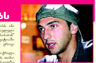
ახალი კონტრაქტი შესთავაზა და ამ ეტაპზე, ალბათ, ყველაზე რეალური სწორედ ამ გუნდში დარჩენა იქნებოდა. მ. ჟ.

წამალი "ფერდი" შეიცავს არაერთ ბიოლოგიურად აქტიურ სამკურნალო ნივთიერებას. "ფერდი" დამამუდგენელი, ტკივილგამაყუარებელი, ანტიბიოტიკური, ანტიმკერბული და მალა ანტიოქსიდანტური აქტიურობის მქონე მცენარეული წამალია. ის გამოიყენება, როგორც დამამუდგენელი საშუალება ვეგეტონეროზის (უბედობა, აგნებულობა, შიში, ნერვული აშლილობა, დაძაბულობა) დროს, როგორც ხეკლუბის დამამკურნებელი. აგრეთვე კუნძაღვის ქრონიკული დაავადების, კერძოდ კი კონტრაქტი და უსრულდა და შესაბამისად, ამინოურა "რედინგში" განთხოვრების ვადაც. ამჟამად, "ხიზანა" თავისუფალი აგენტია და ყოველგვარი ფინანსური კომპენსაციის გარეშე შეუძლია გუნდის მოვლა.