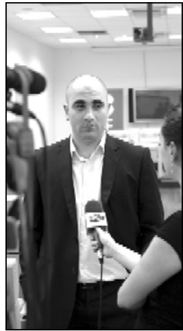
ინოვაციებისა, თუ პროექტების სწრაფი გატანისა და დანერგვის საშუალება.

ერთიანი ინტერნეტ ქსელი კი თავისთავად გულისხმობს სხვადასხვა