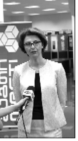
თულია ამ ერთიან ქსელში, რაც სამინისტროს და შესაბამის სააგენტოებს აძლევს საშუალებას, რომ კომპიუტერული საშუალებებით და რესურს ცენტრებით შეიქმნათ თანამედროვე ტექნოლოგიების გამოყენებით, რაც უფრეს კი, ბუნებრივია, ზოგადად ჩვენს საზოგადოებას, დროსაც და გავაძლევს უფრო მეტ საშუალებებს სწრაფი განვითარებისათვის.

ერთიანი საგანმანათლებლო ქსელის შექმნით, საქართველოში უწინმეოლოვანესი ნაბიჯი გადადა განათლების სფეროს განვითარებისა და ევროპულ სტანდარტებთან მიხედვითი საქმეში.