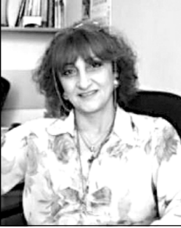
ალტაცუბას და საკუთარ შესაძლებლობებში თავდაუგერებულობის დევიდტა...

ფილმ „აგვისტოს 5 დღის“ პრეზენტაციასთან დაკავშირებით, თბილისში გამართული ღონისძიების კულტურულ-ეტიკეტური თავისებურებებს და იმაზე თუ რაფორ აისახება მისი შედეგები ქართულ კულტურაზე, კულტურული ღვწილი აკაბიზიციებს ესაუბრა.