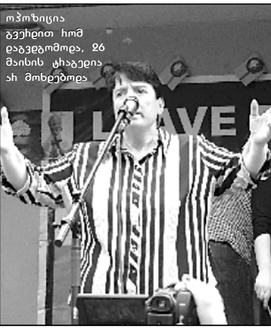
ოპონიცი გეგმით ხომ დავეცომოდ, 26 მაისის სტატიას ში მოხებოდ

საქართველოში პირველი მძიმე შემთხვევა გაფრინდა. იგი, რომელსაც ქვეყნის ტელევიზიამ დასაჯდა, სხვა ქვეყნებშიც მოხდა.