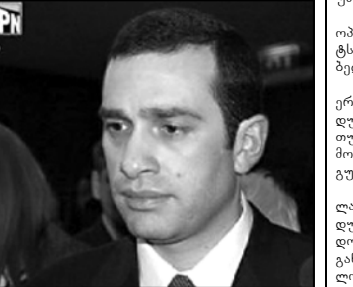
ნაციონალურმა თქვს, „დაიცავი ნოლაიდე“ იქცა.

ამ პირობის თანახმად ისინი ზურაბ ნოლაი-დელს უნდა განუდგნენ. ნოლაიდელს ოპოზიციის ერთ ნაწილში „მიყვავს პარადი“. ყოფილი პრემიერი მეპრემიერულ რიგებში იმყოფება. ალიანსიდან წამოსულ ულტიმატუმს მეპრემიერული მხრიდან დიდი რისხვა მოჰყვა.