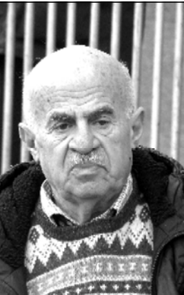
თავისი ლიკა კარნახით მოქმედი ხელი-სულელები და ყველა ობიექტი დაიკავეს.

— შავ ზღვაზე ბრძოლას გადაციციებით უფერებს მთელი შუა აზია. შუა აზია იმის მიხედვით აიღებს თავის ორიენტაციას, შავ ზღვაზე ვინ ვის გალახავს. რადგან დასავლეთის მხრიდან ზღვის თივისების ოპერაცია დაწყებულია, ცხადია, რუსეთი გაილაგება. ესეც რუსეთის ნაგებია. ამიტომ რუსეთს ერთადერთი ავანტიურისტული გზა რჩება, რომელსაც პერსპექტივა არ აქვს. რუსეთს უნდა, დღეს, ახლა, ამ წელიწადში საქართველოს წინააღმდეგ ჩაატაროს ე.წ. ელემენტური ომი, ანუ რამდენიმე საათში საქართველო აიღოს ისე, რომ დასავლეთმა რეაგირება ვერ მოახსროს, და რუსეთმა დასავლეთის რეაქციას დახვედროს საქართველოში თავიდან მოლოდინი.