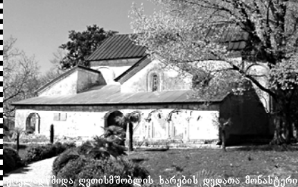
მეც. დავითისმშობლის ხარკის დედათა მონასტერი