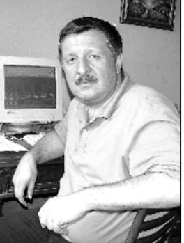
რე, აფხაზეთში დარჩენილი ქართველები კონკრეტულად რა იყვნენ? სსკ-ს აქტივისტების მოძიების მიზნით დაიწყო მუშაობა სსკ-ს აქტივისტების მოძიების მიზნით.

პრემიერის ვადებზე დაიწყო მუშაობა. სსკ-ს აქტივისტების მოძიების მიზნით დაიწყო მუშაობა სსკ-ს აქტივისტების მოძიების მიზნით.