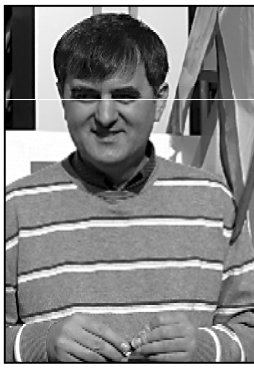
არაკიანს. ყველა აკეთებს თავს არჩევანს...