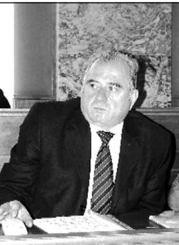
სამართალმცემი (რე) იმერეთის, გურჯისტის, აჭარის, სამეგრელოს, აფხაზეთის რეგიონების თანდათან მიერთების თაობაზე.

— ეს საიდუმლო მუხლი ცნობილი იყო ერეკლე II-საკენ? — რა თქმა უნდა, მან ხელი მოაწერა. ერეკლე II-სა და, საერთოდ, ქართველების სამეფოსთვის (რომელიც იყო იმ დიდი საქართველოს