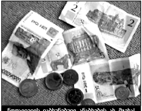
ნოლიდელის დახუხუხები ანაბრაზის ახ მეჩას

სიტუაციაში ყველაფერი დაინერგეს, ვიდრე ვეცადოთ რეკონსტრუქციას, რომელიც შეუძლებელია. ადგილობრივი არ-