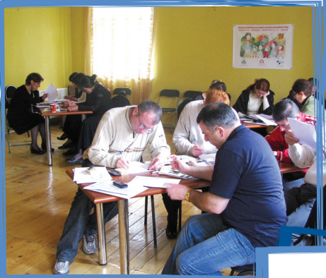
მუშაობა სკოლამდელი განათლების მუნიციპალურ სტრატეგიებზე