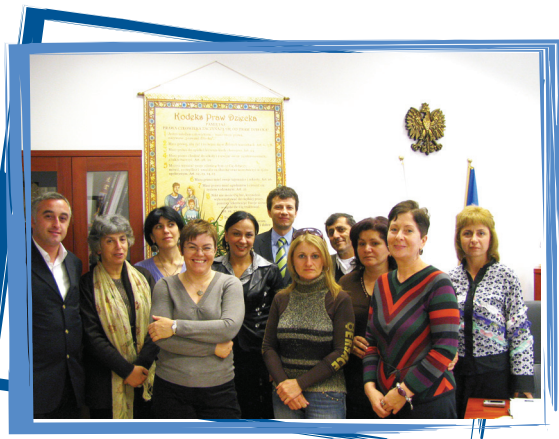
პოლონეთის ბავშვთა უფლებების დამცველთან (ომბუდსმენტთან)