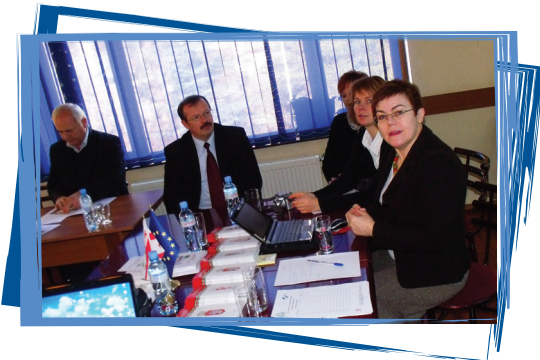
სკოლამდელი განათლების ადგილობრივი სტრატეგიების პრეზენტაცია.