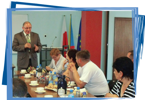
თვითმმართველობის გამომცდილების გაზიარება: შეხვედრა ქალაქ ლომჟას მერთან