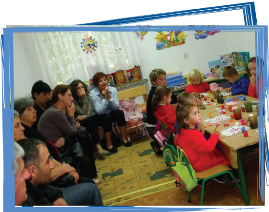
ახალი მეთოდის გაცნობა: ინტეგრირებული მეცადინეობა პოლონეთის სკოლამდელი განათლების ცენტრში

სასწავლო ვიზიტებმა პოლონეთში გაამდიდრა ჩვენი ცოდნა და მოგვცა ახალი ინფორმაცია სკოლამდელი განათლების ალტერნატიული ფორმების ორგანიზების, მართვისა და მეთოდის შესახებ. ეს ვიზიტები ძალზე მნიშვნელოვანი იყო როგორც საბავშვო ბაღების მასწავლებლებსა და მენეჯერების, ასევე თვითმმართველობების წარმომადგენლებისთვის.