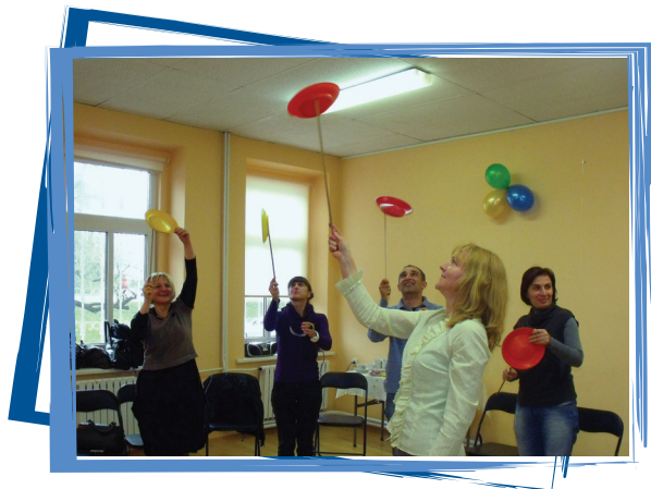
ვეცნობით თამაშის პედაგოგიკას