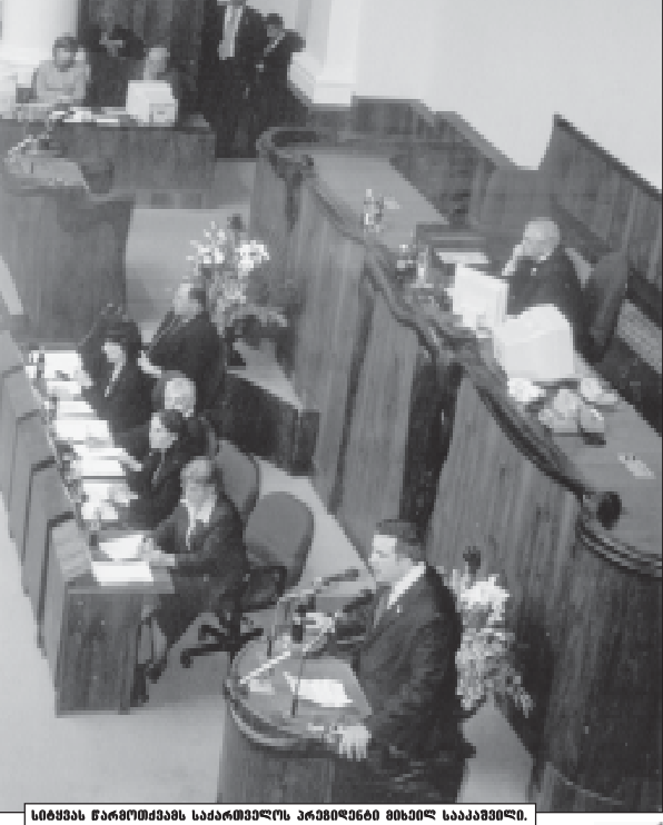
სიმეფა წარმომადგენელი საქართველოს პარლამენტის საბჭოთა სისტემის წევრები.

პარლამენტის პირველი სესიონი გაიმართა 22 აპრილს. მისი მთავარი მიზანია საქართველოს სახელმწიფოებრივი ერთეულის აღდგენა და განვითარება. პარლამენტი შეიქმნა საქართველოს სახელმწიფოებრივი ერთეულის აღდგენის მიზნით. მისი მთავარი მიზანია საქართველოს სახელმწიფოებრივი ერთეულის აღდგენა და განვითარება.