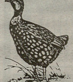
მცირე ზომის მამალი ფრინველი ქომების ოჯახიდან