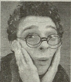
ავის მიტყელო, ენამერალი (იშვოფემა კადარ მიშა)