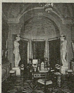
საბანებში მონაწილეები სვედანიშნულების ოთახი