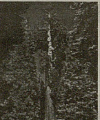
გიგანტური წრდი ამერიკული ნინოვანი (მაშინტის) ხე