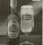
სასმელის ძირითადი ნედლეულის აქტიური ფერმენტების შემცველი ფორმა