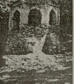
სამონასტრო კომპლექსი მცხეთიდან 1,5კმ დაშორებით