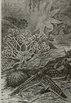
ფსევდო მცხოვრები ორგანიზმების ერთობლიობა