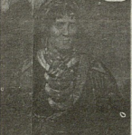
სემიოვლების ბელადი (რაისსენტი შინ რაიდი)