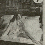
სანოლი (ჭა და ნიგნ)