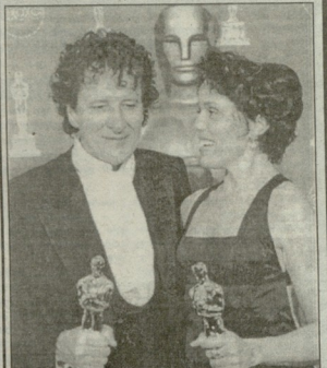
1996 წლის საკულტურო მახიობები - ჯურის ბანის და ურჩხულის მაცოდრებელი.