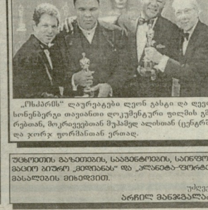
„ოსკარები“ დაჯიურება - რევილიზი ურჩხულის მინჯად და პროფესიონალი მხეცნი და ჟიურის „ინდივიდუალური“ შემსწავლებელი.