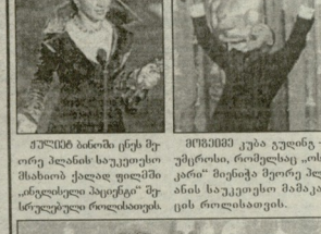
„ოსკარები“ დაჯიურება - რევილიზი ურჩხულის მინჯად და პროფესიონალი მხეცნი და ჟიურის „ინდივიდუალური“ შემსწავლებელი.