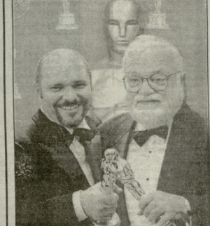
„ოსკარები“ დაჯიურება - რევილიზი ურჩხულის მინჯად და პროფესიონალი მხეცნი და ჟიურის „ინდივიდუალური“ შემსწავლებელი.