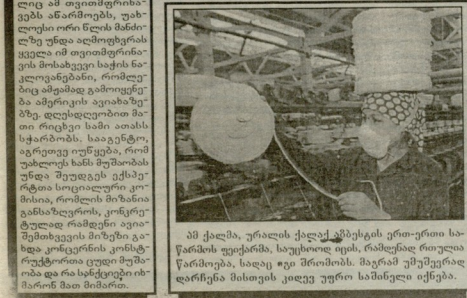
78 წლის მანა ციკაია ხიმამღების მთელმთრე...