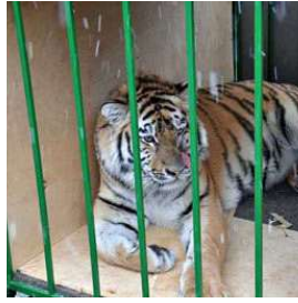
Тигр впервые стал пациентом антибиотиков, чтобы предотвратить возможное воспаление.

Процедура прошла нормально, и Жора уже начал восстанавливаться и есть. По словам медиков, в будущем тигру сделают еще несколько операций. Сроки их проведения будут зависеть от темпов выздоровления животного. В ближайшее время ему будут давать