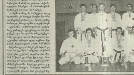
ბრაზილიელი კარგა — (გურუ) რეპრეზენტაციის რეაგირება კარგა