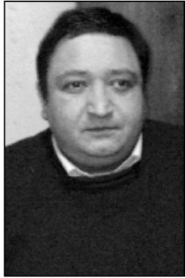
ქსენოფობიური სომხური ეკლესიის მეთაური...

შედეგად, რომელიც მიხედობს მთავარ მიზეზებს და ხელისუფლების მიერ დახმარების ნაკლებობას. ამასთანავე, მნიშვნელოვან როლს თამაშობს ქსენოფობიური სტერეოტიპები და ექსტრემიზმი. ამიტომ, მნიშვნელოვანია ხელისუფლების მხარისგან განსხვავებული პოლიტიკური კურსის აღქმის შედეგად, რომელიც მიხედობს მთავარ მიზეზებს და ხელისუფლების მიერ დახმარების ნაკლებობას.