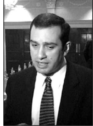
ტარებულ არასწორ პოლიტიკაზე საუბრობს აქტიურად ირაკლი ალასანიამ რეგიონებში შეხვედრის მოსახლეობასთან, სადაც არა მხოლოდ ადგილობრივებთან

მართალია სააკაშვილი და მისი ნაქები სოფლის მეურნეობის მინისტრი ბაკურ კვეციანი მუდმივად და ახალ პროექტებზე აპროტესტებენ, რომელიც სოფლის მეურნეობის კუთხით იგვემება, მაგრამ ამ ახალი პროექტების ჯანსაღიანობის — ბაყაყების ბიზნესის აყვავება და ა. შ. — აშკარად არც სააკაშვილს სჯერა და მთი უფრო ქართულ გლეხობას, რომელმაც კარგად იცის, რომ მამამაპური თობი ბარაკიანად თუ არ მოიქნია და ამინდი თუ არ შეწყვი, ხელისუფლების დახმარების და მთი უფრო მინის ნაკვეთის უსაყიდლოდ მონყვის იმდადაც არ უნდა იყოს. სწორედ სოფლის მეურნეობაში გა-