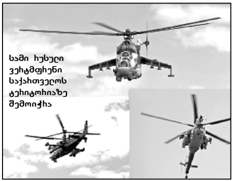
სამი ხელი ვერტმფრენი საქართველოს სივრცეში შემოიჭრა

ასევე ნათქვამია სამინისტროს ოფიციალური განცხადებაში, რომ სამინისტრო საერთაშორისო თანამეგობრობისა და მოქალაქეების შეიარაღებული ძალების მიერ საქართველოს საჰაერო სივრცის დარღვევის ფაქტის სათანადოდ შეფასებას და მოუწოდებს განაგრძოს ზემოთაღნიშნული 2008 წლის 12 აგვისტოს ექვსპუნქტიანი შეთანხმების შესრულებისა და საერთაშორისო სამართლის ფუნდამენტური ნორმებისა და პრინციპების პატივისცემის მოთხოვნით, — აცხადებს საგარეო უწყება.