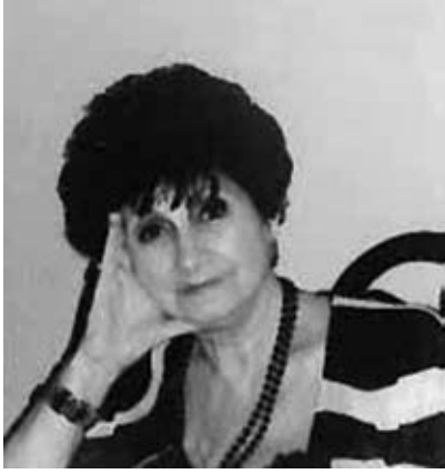
დაბადების დღის მილოცვა

დაბადების დღეს გილოცავს, მზესუმზირა და იაო. გვირილა თავს აკანტურებს, ვარდები სად არიანო?