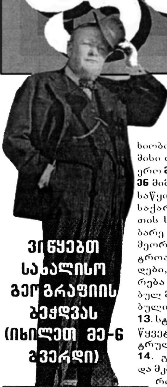
ჟინჯაბი სასალინი ბერბრაუნი ბეჭდვას (იხილეთ გე-6 გვერდი)

თარაზულა: 4. მსოფლიო კინემატოგრაფიის მწვერვალთა დამკვირვებელი ფრანგი მხახიობი ქალი („როკი და მისი ძმები“) 6. სამეცნიერო მწვერვალისაკენ მიმავალი ადამიანის საწყისი „ტიტული“. 8. საქართველო-თურქეთის საზღვართან მდებარე პატარა ქალაქი. 9. მეორე სახელი ქალაქ ტროასი. 11. გადასახადები, რომლებიც ეკისრება ომში დამარცხებულ მხარეს გამარჯვებულის სასარგებლოდ. 13. სტუდენტური „ჭაპან-წვევების“ ყოველსემესტრული „მწვერვალი“. 14. გამაღიზიანებელი და მკებნარე ანუ როგორი... „იმითებურად“.