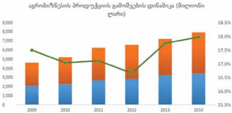
აგროსასურსათო სექტორში შექმნილი დამატებითი ღირებულება (მიმდინარე ფასებში, მლნ ლარი)