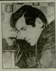
ლო სხვადასხვა დროს მოამაშვესთაისი, რომლებიც მასწავლებლის მათთვის მანტრის ვაგონებდნენ.