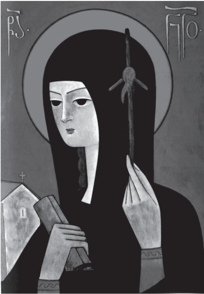
წმ. ნინო. ხატმწერი რეზო ადამია