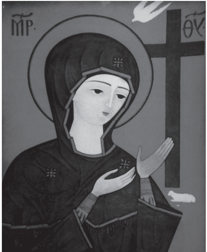
წმ. ნინო. ხატმწერი რეზო ადამია