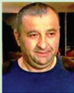
მხატვარი გოჩა ბალაშვილი