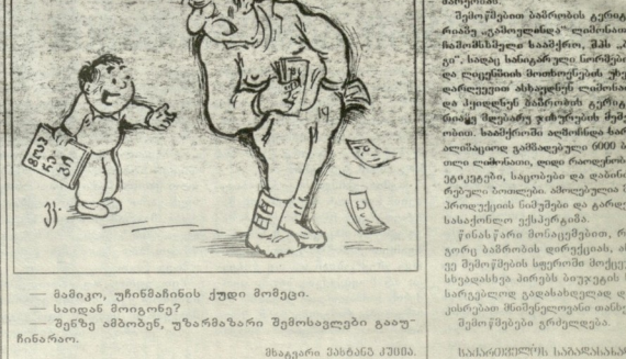
ნახაზი: ვახტანგ კვიციანი.