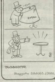
საუბრისმოდ მზავგარი მზაბნა მკონია