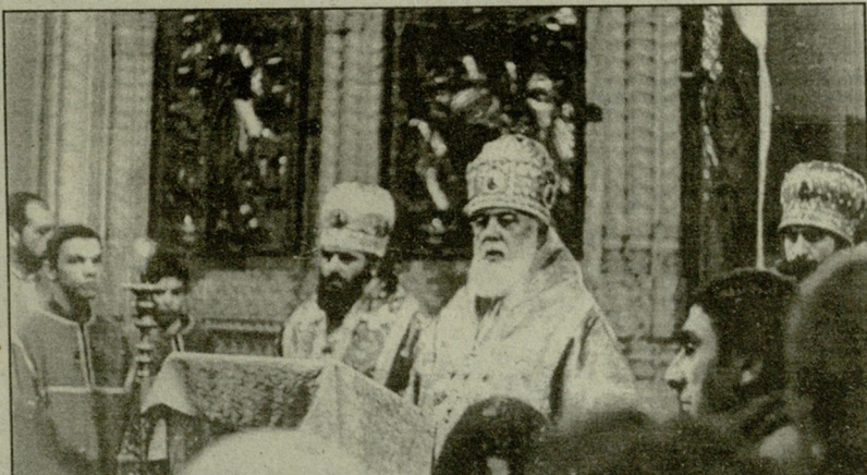
სურათივზე: (ზემოდან) დიდი სამეცნიერო საბჭოს სხდომა; ყვავილებით ამკობენ ივანე ჯავახიშვილის საფლავს; სიონში საზეიმო წირვაზე.