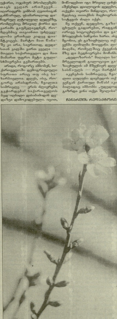
პირველი კვირტი. ბარლაშ მინდორის ფოტო.