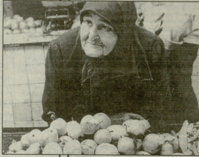
მამბანბნ ქაშისი ფოტო.

გაიბისან გარჯამი გაილია წლები... მოუკვდა ჩემი დედა — საირო, გუბიშვილი წყინარი, რომლხეა არსდრო არავისთვის არც გილოვანა ეკვლისკეთილი არ მუქვებოდა. არც სხე-სხამდრო მუღია წყნა — საიგობა იგი და იმავით სულ ეკვლიდა, ვეკვლ დედას, მაგრამ (გრამანო არ ამ მამისეობით) იგი ისეთი სისხლავა, მამ ვერხლებო ვერ მუქვლა ჩემი ეკვლიშობითი, ხანდამხული და ხანგალოლი დედა ახეც მისი ხანითა, როცა ივლი თუ, ცხოვრების ეკვლიშობითი ვერ გაბეჭდეს მისი ვეკვლი სული, მისი დედა სიყვარულითა და სითხოითი სხეც ეკვლი.