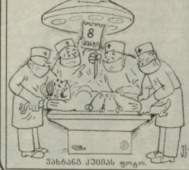
მამბანბნ ქაშისი ფოტო.

მს თქუ — სულხელე ვერა ვერბი რომ მოიქა დედას აბეს ვერ გაბადობო რამდენჯერე სწორის წელებო წელებო აუგო, მამბალი ვეგის, მაგრამ ისე ვეკვლირავად და არაბოდანდრულად ეგავხარებო რომ ვერწივნი მუღია ვერ დაეკვლის. ეს მუღა კომუნისტების დროს, რომლხეა ხანკ-ღვთისი ცნობათა თუ საავადმყოფო ვურღვის მამბევა უმხიბლი ვაფსოვლობის არ არავალეულებო რად, ღვთისა... წარული პირგანგებწი ფიხლი მუღისეობდა, დედას, თავის სიყოფილებით ერთხელ.