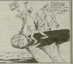
მუხრანის ბაბუშის ნახატი