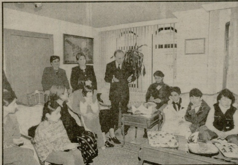
გილვაბა საპარტოვალოს საბაღროში.

შეგების სკუმრობა თურქეთის პრესისა და გულევიზიის კურაღლები ცენტრში მოქმედა.