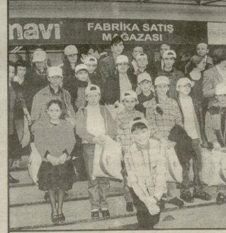
გაღაზინის დათვაღღიერაბის შავღაბა.

ეს ბავშვები 21-ე საუკუნის მოქალაქენი არიან. ისინი გააგრძელებენ საქართველოსა და თურქეთს შორის კეთილმეზობლობას და ურთიერთანამშრომლობას, გაიხსენებენ თურქეთში გატარებულ დღეებს და, როგორც ჩვენ გვიყვარს ხოლმე ეკზიუბერის სიტყვების გამოვრება, ისინიც იტყვიან — „ჩვენ ყველანი ჩვენი ბავშვობიდან მოვიდევართ“.