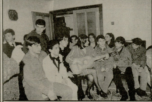
თანატოლბანი ვალე დამბბორღწანი.

დაძეს სახელდახლოდ უსწველს მათიშის ქართული ეკავის ილითები. მასხან ილგაზს ძალიან მოსწონებოდა ქართული ჩოხა-ახალუხი. თურქეთში მხოლოდ გამორსულად სტუმრებს ხედებიან ისე. ქართველი ბავ-