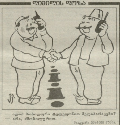
ალი შობილერი ტელეფონით მელაპარაკები? არა, მშობილერიო. შახაგერი მახანან კანასი.