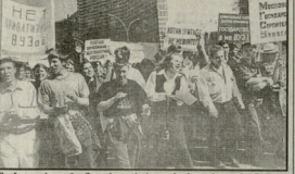
მოსწავლე ახალგაზრდა სტუდენტებისთვის, რომლებსაც პირველი ახალგაზრდა მემორიალური სტუდენტებისთვის...