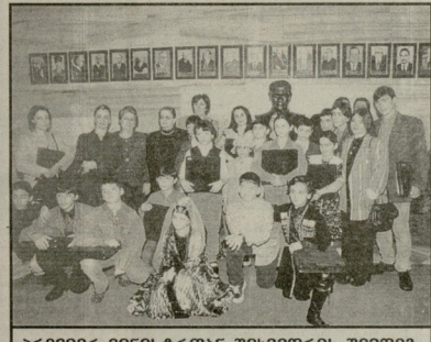
არამიერ-მინისტრთან შხვვადრის შხვვად.