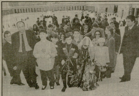
ყვავილბაით შავაგას ათათურქის გავზოლუაში.