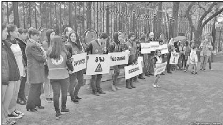
ვისუფლებსა და, საჭიროების შემთხვევაში, მათი დაჯარიმებისკენ.

თბილისში დღეს უკვე იმდენი ავტომობილია, რომ ვერანაირი ავტოსადგომი მოთხოვნას ვერ დააკმაყოფილებს: „თბილისში, დაახლოებით, 40 000-მდე ავტოსადგომია და 400 000 ავტომობილი. როგორ წარმოგიდგენიათ ამდენი ავტომობილის მოთხოვნა დაკმაყოფილდეს? გამოირიცხებოდა. ვერც