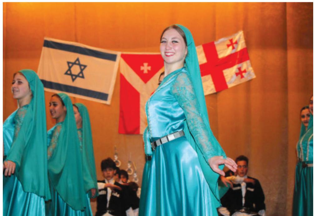
(დასასრული II გვერდზე)

ხელოსნებად, ვაჭრებად, ორივე ქვეყანაზე უზომოდ შეყვარებულ ადამიანებად შემორჩნენ მესხიერებას. ქორწილი არ გამართულა, პატარძალი არ შემოსულა ქართულ ოჯახში "ებრაელებთან ნავაჭრის" გარეშე, აქ სიტყვა, "არ იშოვება"