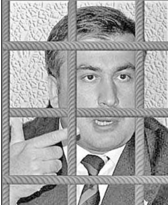
„ჰააგის ბრიგანაი სააკაშვილისთვის“ დეზინფორმაციას რუსულმა მედიასაშუალებებმა მიმართეს მაშინაც, როცა ჰააგის სისხლის სამართლის საერთაშორისო სასამართლომ პროკურორ ფატუ ბენსუდას 2008 წლის ომის გამოძიების უფლება მისცა. 2016 წლის 27 იანვრის პუბლიკაციაში გამოცემა „ИЗВЕСТИЯ“ ( http://izvestia.ru/news/602734 ) წერს: „დღეს სისხლის სამართლის საერთაშორისო სასამართლოს წარმომადგენლებმა განაცხადეს, რომ დაიწყეს სამხრეთ ოსეთში მომხდარი სამხედრო დანაშაულის გამოძიება, რომელიც 2008 წელს მიხედვით სააკაშვილის რეჟიმის დროს განხორციელდა“, - მაშინ

ვე იმ პერიოდშიდან პანკისში იატაკქვეშეთის მებრძოლები, მათ შორის „კავკასიის საამიროს“ ბოვიეები იმყოფებიან. „ისლამური