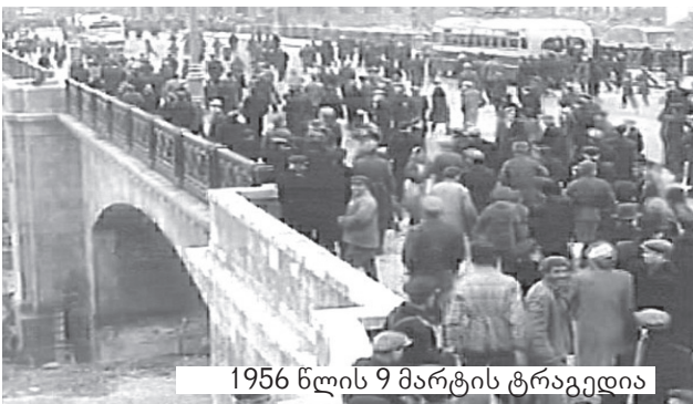
1956 წლის 9 მარტის ტრაგედია

გასული საუკუნის 20-იანი წლების შემდეგ ბოლშევიკურმა რეჟიმმა მოახერხა ქართული საპროტესტო მუხტის შესუსტება და გარკვეულწილად, მისი ჩარჩოებში მოქცევა, თუმცა იყო მასიური რეპრესიები, ომი და მძიმე მატერიალური პრობლემები. შემდეგ კვლავ იწყება შინაგანი დულილი და მისი გარეთ გადმოფრქვევის საბაზიცი წდება - 1956 წლის მარტი საქართველოში ბევრისთვის ეროვნულ შეურაცხყოფად იქნა აღქმული, ათეული წლების მანძილზე მსოფლიოში ქართული გენის გამონათებად აღიარებული სტალინის პიროვნების განქიქება და მანამდე კი ბერიას დღემდე ბურუსით მოცული ფიზიკური ლიკვიდაცია.