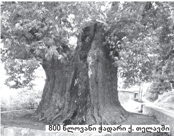
800 წლოვანი ჭადარი ქ. თელავში

შემთხვევით არაა, რომ გენეოლოგიის სიმბოლიკად სწორედ ეს 800 წლოვანი ჭადარია ქცეული, აღნიშნული იდეის ავტორი კი ისტორიის მეცნიერებათა დოქტორი, პროფესორი რეზო ხუციშვილი გახლავთ. სწორედ ამ ჭადარს წარვუმძღვარებთ წინ იმ დიდებული გვარის ისტორიას, რომელიც ყიფიანების წარმომავლობას ასახავს.