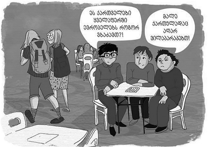
★ მრავალფეროვანი ევროპა ★