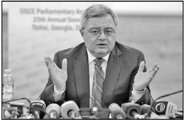
საქართველოში პარლამენტის თავმჯდომარე დავით უსუფაშვილი არაღიარებულ მთიან ყარაბაღში მიმდინარე მოვლენებს ეხმაურება. უსუფაშვილი განვიტარებულ მოვლენებზე შეშფოთებას გამოთქვამს და აცხადებს, რომ საქართველოს ხელისუფლებას სურს, ხელი შეუწყოს ყველა პრობლემის მშვიდობიანი გზით მოგვარებას.

„მინდა, თქვენი სახელით შეშფოთება გამოთქვა იმაზე, რაც ჩვენს უშუალო სამეზობლოში ხდება. სამწუხაროდ, იცით, რომ არის მსხვერპლები. ჩვენ ვართ შეშფოთებული, რადგან შეიარაღებული კონფლიქტი მიმდინარეობს საქართველოსთვის ორ მოძიე ვრს შორის. ჩვენი პოზიცია იყო და არის ურყევი – ჩვენ გვინდა მშვიდობა კავკასიაში, ჩვენს ქვეყანაში, უშუალო სამეზობლოში და გვინდა, ხელი შევუწყოთ ყველა პრობლემის მშვიდობიანი გზით მოგვარებას. ამიტომ მივესალმებით საერთაშორისო საზოგადოების აქტიურობას ამ პროცესში. გვაქვს ჩვენი მოძიე აზერბაიჯანელი, სომეხი ხალხების, ლიდერების კეთილგონიერების იმედი. იცით, რომ საქართველოს ხელისუფლება, მთავრობა, შესაბამისი უწყებები, ყოველდღიურ რეჟიმში არიან ჩართულნი შესაბამის პროცესებში, არიან კონტაქტში შესაბამის თანამდებობის პირებთან. ეს არის აუცილებელი საქართველოს უსაფრთხოების უზრუნველსაყოფად და ჩვენს სამეზობლოში მშვიდობის შესანარჩუნებლად. ამ საკითხზე ყველა ერთ პოზიციაზე ვართ და ასე იქნება მომავალშიც“, – აღნიშნა დავით უსუფაშვილმა.