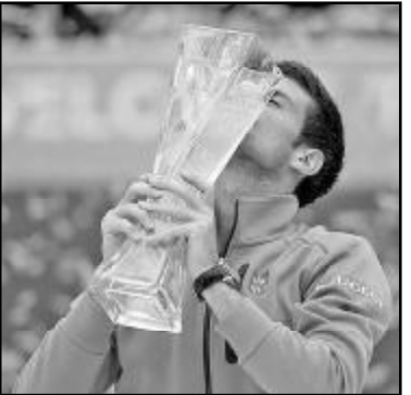
კეიმ – 501 815 ამერიკული დოლარი.

მსოფლიოს ნომერ პირველმა ჩოგბურთელმა ნოვაკ ჯოკოვიჩმა კარიერაში 28-ე მასტერსის ტურნირი მოიგო, რაც საჩუქრად მარვენებელია. ნოვაკმა მაიამის მასტერსის ფინალში იაპონელი კეი ნიშიკორი 3:1, 6:3 დაამარცხა. შესვენდა საათსა და 27 წუთს გაგრძელდა. სერბმა 9-დან 5 ბრეიკი შეასრულა. ჯოკოვიჩმა კარიერაში 714-ე შესვენდა მოიგო. ამ მაჩვენებლით „ნოვემ“ თავის მწვერთნელს ბორის ბეკერს (713 მოგება) გადაასწრო და მე-11 ადგილზე გადაინაცვლა. ჯოკოვიჩმა მაიამის მასტერსის მოგებით 1 028 300 ამერიკული დოლარი გამოიმუშავა, ხოლო