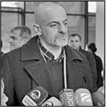
ფორუმის წევრები პარლამენტში თანამდებობებს ტოვებენ.

ფორუმის წევრები პარლამენტში თანამდებობებს ტოვებენ. „პარტიის პოლიტიკური საბჭო, ფრაქცია და წარმომადგენლები ადგილობრივ თვითმმართველობებში შეუწყობენ ხელს არსებული სელიფულის სტაბილურობას მომავალ არჩევნებამდე“ , – განაცხადა შარტავამ. გარდა ამისა, ეროვნული