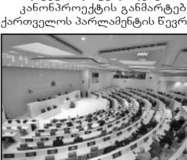
პარლამენტის სესიის დასრულება.

პარლამენტის წევრობის კანდიდატობის შემთხვევაში, საქართველოს პრემიერ-მინისტრს წინასაარჩევნოდ თანამდებობიდან გადადგომის ვალდებულება არ ექნება , – ამას „საარჩევნო კოდექსში“ დაგეგმილი ცვლილებები ითვალისწინებს.