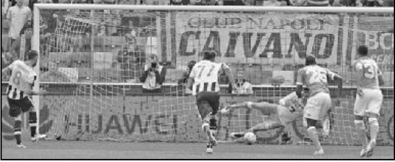
იტალია. „იუვენტუსი“ – „ემპოლი“ 1:0, „ლაციო“ – „რომა“ 1:4, „უდინეზე“ – „ნაპოლი“ 3:1, „ფიორენტინა“ – „სამპდორია“ 1:1, „ატალანტა“ – „მილანი“ 2:1, „ინტერი“ – „ტორინო“ 1:2. ესპანეთი. „ბარსელონა“ – „რეალ“ 1:2, „ატლეტიკო“ – „ბეტისი“ 4:1, „სევილია“ – „სოსიედადი“ 1:2, „სელტა“ – „დეპორტივო“ 1:1, „ეიბარი“ – „ვილიარეალი“ 1:2, „ბილბაო“ – „გრანადა“ 1:1. ინგლისი. „ლესტერი“ – „საუთჰემპტონი“ 1:0, „ლივერპული“ – „ტოტენჰემი“ 1:1, „ასტონ ვილა“ – „ჩელსი“ 0:4, „არსენალი“ – „უოტფორდი“ 4:0, „ბორნმუთი“ – „სიტი“ 0:4. გერმანია. „ბაიერნი“ – „აინტრახტი“ 1:0, „ბორუსია“ – „ვერდერი“ 3:2, „გლადბახი“ – „ჰერტა“ 5:0, „ლევერკუზენი“ – „ვოლფსბურგი“ 3:0, „ინგოლშტადტი“ – „შალკე“ 3:0. საფრანეთი. „პარი სენ-ჟერმენი“ – „ნიცა“ 4:1, „მონაკო“ – „ბორდო“ 2:3, „ლორიენი“ – „ლიონი“ 1:3.