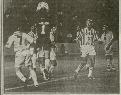
ფიზიკური აცვია. ფიზიკური აცვია. ფიზიკური აცვია.