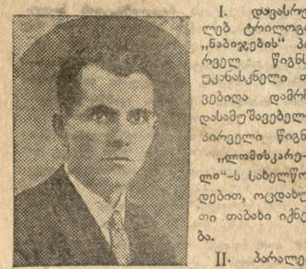
საბ. თავდაცვითი მხარე